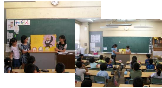
【図書委員によるよみきかせ】

読書週間には、朝学習、20分休み等を利用し、様々な取り組みを行いました。ご家庭でも10分間読書へご協力いただきありがとうございます。