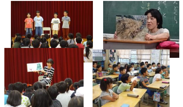
【「おはなしの森」の皆さんによるよみきかせ】